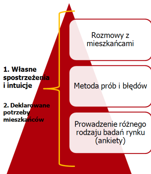
Schemat 1. Dostosowanie oferty dk do potrzeb mieszkańców – źródła informacji o potrzebach (diagnoza)