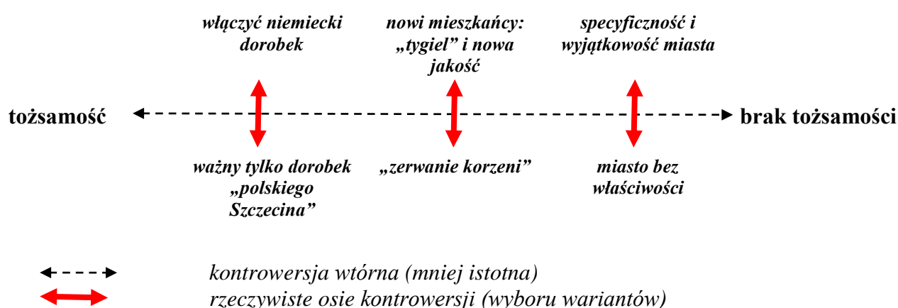
Rys. 3 – Osie kontrowersji w wypowiedziach dotyczących tożsamości Szczecina

Wyżej scharakteryzowane ujęcia problemu tożsamości miasta zakładały raczej deskryptywne rozumienie tożsamości, choć na dobrą sprawę elementy myślenia normatywnego pojawiały się w tych głosach, które postulowały „odszukiwanie tożsamości”, sugerowały, że ma ona ukryty (choć już działający), „podświadomy” charakter. W badanym materiale można jednak także znaleźć ujęcia czysto normatywne – są jednak stosunkowo nieliczne, w świetle których